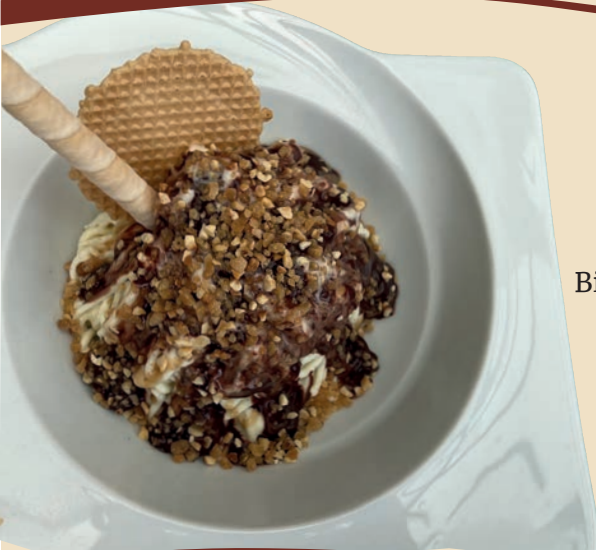
„KnusperNudel“ Krokant-Spaghetti-Eisschale Bio-Vanillemilcheis, Schlagsahne, mit viel Haselnusskrokant, Schokoladen- & Nusssoße D, H, M

Alle Spaghetti-Eisschalen in einer GenussGröße für 10,90 €