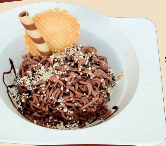
„SchokoNudel“ Schokoladen-Spaghetti-Eisschale Schokoladenmilcheis, Schlagsahne, hausgemachter Schokoladensoße & weißer Schokoladenparmesan D, H, M