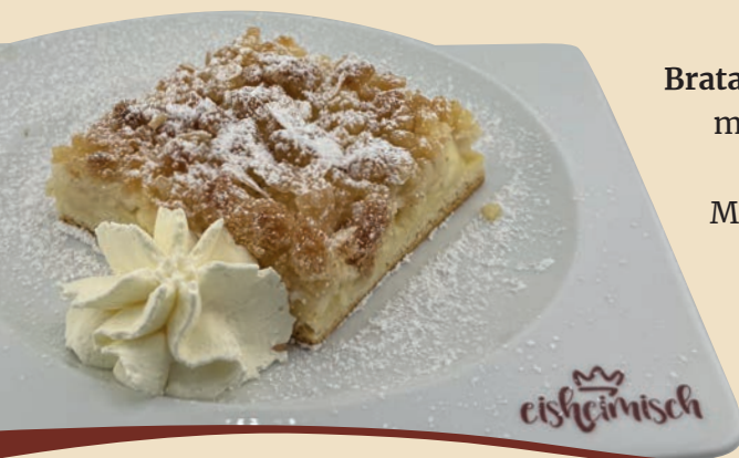
Bratapfelkuchen auf Hefeteig mit Marzipan, Rosinen Puddingcreme und Merseburger Grumbeln 4,20