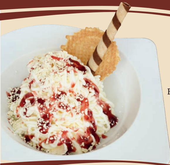
„Classico-Spaghetti“ Spaghetti-Eisschale-Erdbeer Bio-Vanillemilcheis, Schlagsahne, unsere hausgemachte Erdbeersoße & viel weißer Schokoladenparmesan D, M