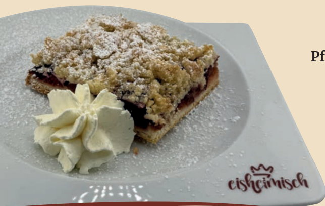
Pflaumenkuchen auf Hefeteig mit Puddingcreme und Merseburger Grumbeln 4,20

Genießen Sie unseren frisch gebackenen Obstkuchen auf Hefeteig mit Puddingcreme & Merseburger Grumbeln (Streuseln)